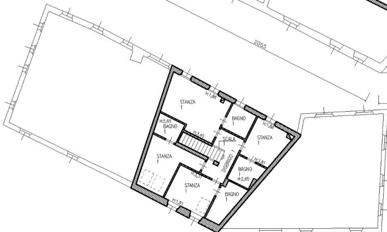
PIANTA TERZO PIANO H. varie

Compilato da GEOM. DARIO FRONZA Iscritto all' GEOMETRI della Prov. di TRENTO N. 1295 Mod. Am (Fabbricati)