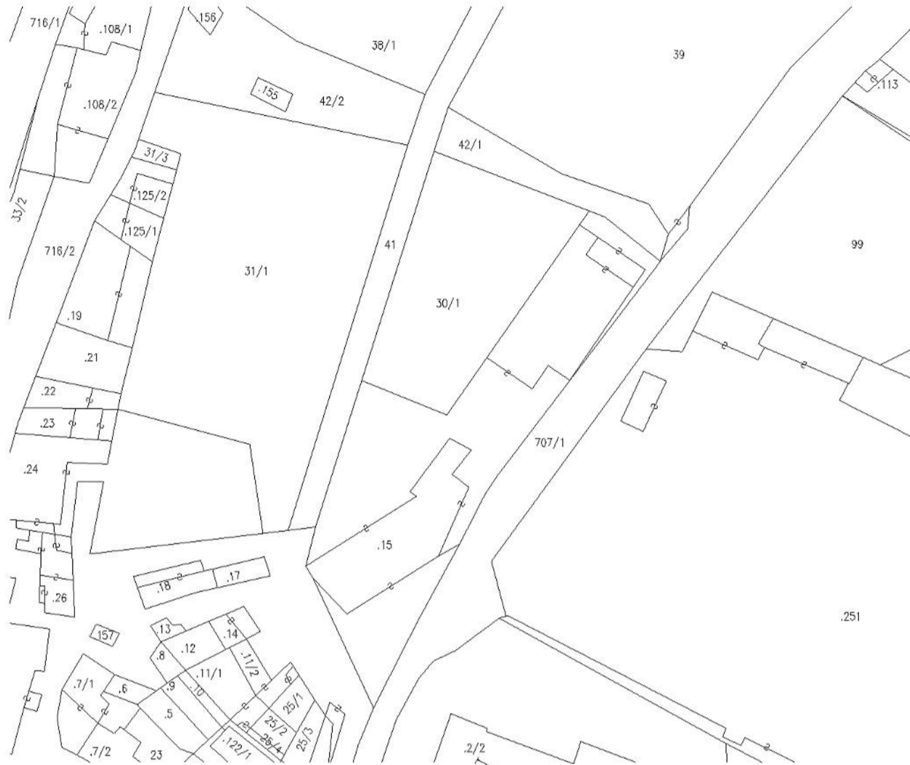
ESTRATTO DI MAPPA 1:1000